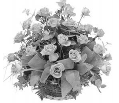
Жена, дети, внуки.

Две пятерки встали рядом. Получился юбилей. Но печалиться не надо, Улыбайся веселей. В юбилейный день рожденья Шлем свое мы поздравленье: Быть веселым, справедливым, Жизнерадостным, счастливым, Чтобы годы не спешили, И на все тебя хватило. Желаем много сил, удачи, Желаем сердцу пламенеть Назло годам, чтоб не стареть!